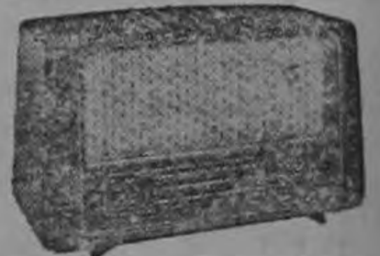
Radios de corriente todo voltaje