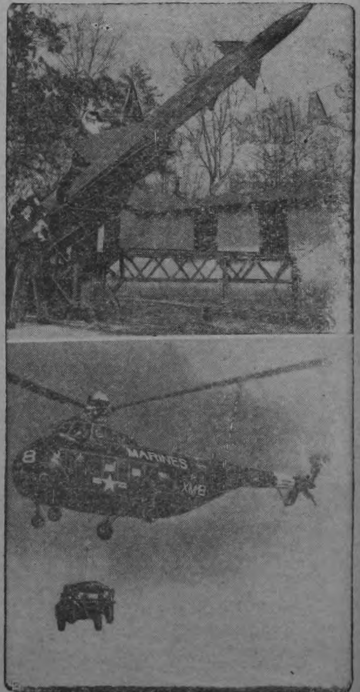
El simpático y legendario San Nicolás se encuentra ensayando un nuevo modo de transportación en una base de la fuerza aérea en Andrews. Esta vez, San Nicolás será disparado desde un cohete de los llamados "Nike" del ejército americano; y tratará de caer en el jeep que se va en la parte inferior del cohete